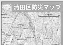
清田区防災マップ