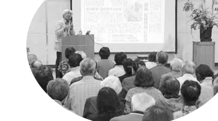
10月23日(日) 北野福祉まつり 人形劇やダンス、災害講演会など、盛りだくさんの内容で地域の交流を深めました。

清田区のホームページ「きよた ファン 倶楽部」でもさまざまな行事の様子を紹介しているよ。