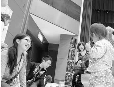
10月23日(日) 清田区子どもまつり ジュニアリーダーが企画運営を担当！ゲームやイベントで楽しく遊びました。