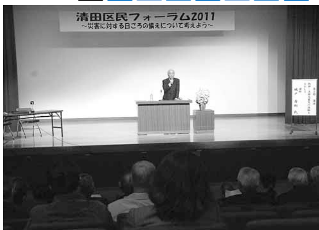
11月4日(金) 区民フォーラム 清田区誕生の記念日に「防災」をテーマに開催。日頃から一人一人が防災意識を持つことの大切さを学びました。