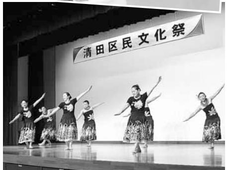
10月15日(土)・16日(日) 清田区民文化祭 日頃の練習の成果をステージや展示で披露。来場者の目を大いに楽しませました。