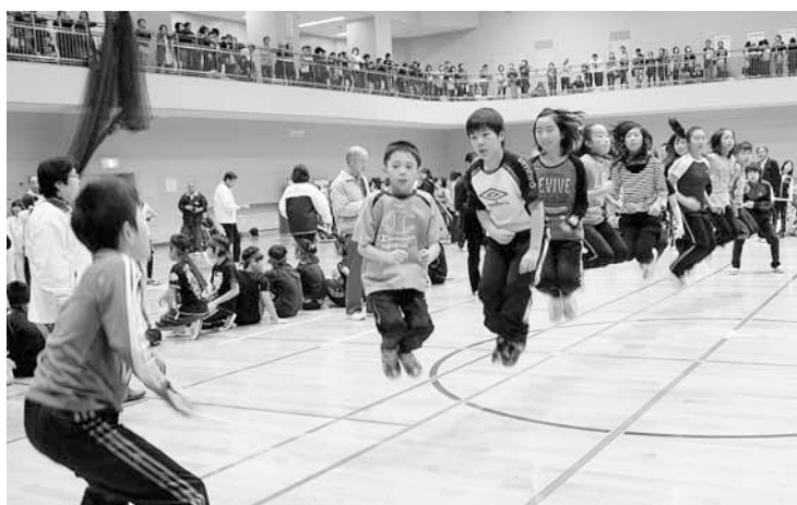
11月12日(土) 少年少女大なわとび大会 優勝目指してジャンプ！ 区内の小学生43チーム615人が参加し、息を合わせて元気な跳躍を披露しました。