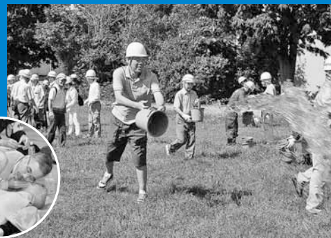
▲てっぽく・ひろばと手稲鉄北小学校体育館で、震度7の大規模な地震を想定した手稲区防災訓練が行われ、地域住民をはじめ防災関係機関や団体など約300人が参加しました (9月1日)。