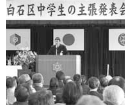
白石区中学生の主張発表会