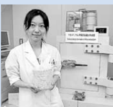
↑ゲルマニウム半導体核種分析装置で検査

この施設では、市内に流通する食品や飲料水などに、放射性物質が含まれていないか検査しています。 みんなで、北海道産キャベツの検査を体験しました。容器いっぱいキャベツを詰めて、重さを測定した後、ゲルマニウム半導体核種分析装置に入れて準備完了。約1時間の検査の結果、放射性物質は検出されず、安全が確認されました。