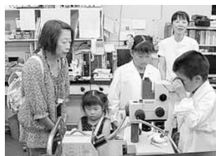
上：顕微鏡で、肉眼では見えない花や葉の細胞などを見てスケッチしました。

新生児や乳幼児、妊婦の病気を早期発見するためのマス・スクリーニング（集団検査）を行い、早期治療へ結び付けています。 22年度からは、検査対象を従来の6疾患から26疾患に拡充。今では、全国でもトップレベルの検査をしています。