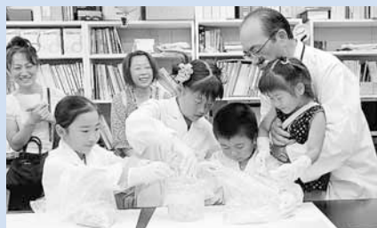
↑キャベツをみんなで詰め込みます