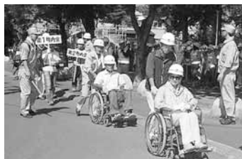
澄川小学校へ自主避難開始

避難所の運営をスムーズに行うための訓練として、避難者名簿の作成などを行う自主運営訓練を実施。避難所での共同生活を営むためのルール作りや、給水車から水を受け取り、飲料水を確保する訓練などを行いました。