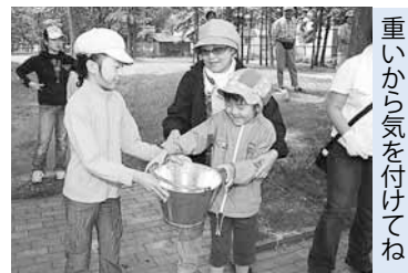
重いから気を付けてね

同町内会では、訓練以外の取り組みとして、地域内の防災マップを独自に作成。また、災害時の連絡網を整備し、災害弱者となる一人暮らしの高齢者や母子世帯の居場所を把握して、災害に備えています。