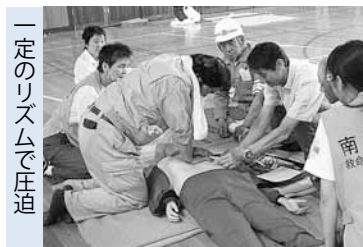
一定のリズムで圧迫

同地区では、毎年自主防災訓練を実施しており、今年で14回目。澄川中学校の生徒も参加し、消防ポンプを使用した放水訓練のほか、心肺蘇生法訓練やAED(自動体外式除細動器)の操作訓練、毛布を使った応急担架の作製などを行う救出救護・搬送訓練が行われました。