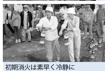
初期消火は素早く冷静に