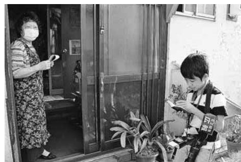
声掛け活動を取材する見込記者（右）

笑顔の秘密を発見 篠路五ノ戸町内会の方々は「見守り活動」とは呼ばず「声掛け活動」と呼んでいます。「お互い声を掛け合って元気を分けてもらっているんだよ。だから見守り活動とは呼ばないんだよ」と教えてくれたのは春原会長。皆さんの笑顔の理由を見つけました。この「声掛け活動」が町内会行事に参加するきっかけになるなど、思わぬ効果もあったそうです。