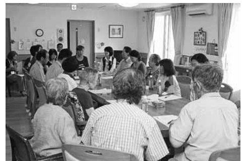
訓練後に行われる反省会の様子

同館の避難訓練には、消防署の職員や地域の消防団のほか同町内会の方々も参加します。開設当初は、施設の様子を知ってもらうために町内会へ訓練の見学案内をしていたそうです。今では同町内会の方が火災にあった際には、同館を一時避難場所として提供する準備を整えるなど、お互いに協力し合う関係になりました。