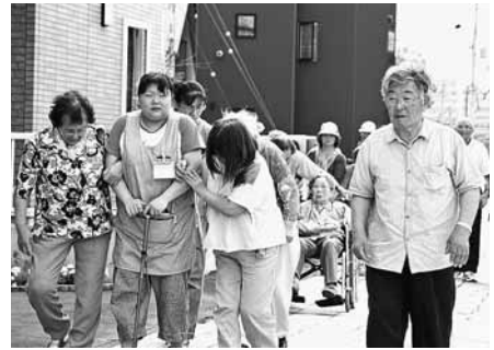
避難者を誘導する春原会長（右）