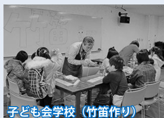
子ども会学校 (竹笛作り)