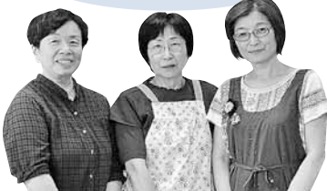
絵画サークル アール伏古の皆さん

札幌軟石でできた旧倉庫を利用したお店がたくさんあります。「昔の札幌」が感じられて素敵ですよ。