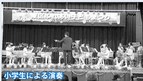
小学生による演奏