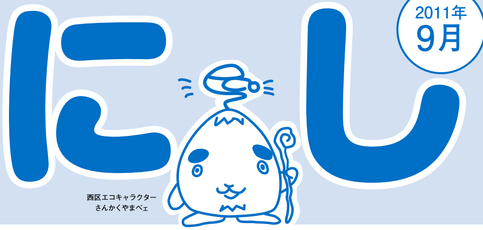
西区エコキャラクター さんかくやまべエ

区民のページで取り上げてほしいテーマなど、皆さんからのご希望やご意見をお寄せください。はがき、ファクス、Eメール nishi@city.sapporo.jp で西区総務企画課広聴係へ。