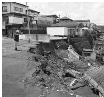
地震で崖が崩落した箇所。一軒一軒、崖崩れや地割れなどの被害を計測した。

3月11日に発生した東日本大震災で被災された皆様に心よりお見舞い申し上げます。ここでは、被災地に派遣され支援活動を行った職員からのレポートを通じて、現地の様子、防災のポイントを紹介していきます。