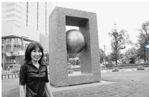
大通公園4丁目の「真無」