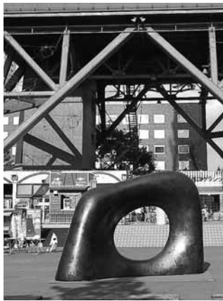
大通公園1丁目の「妙夢」