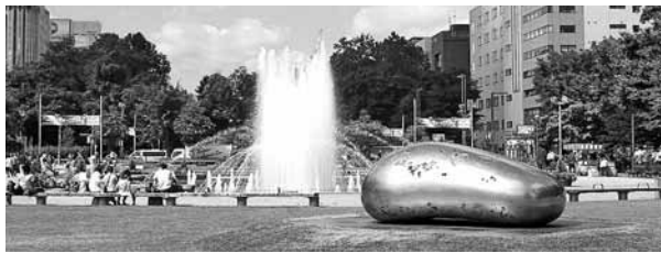
大通公園3丁目の「意心帰」

上記のほか、JR札幌駅、札幌コンサートホールKitara、知事公館に作品を常設。また、会期中は中島公園に3点、サッポロファクトリーに1点を展示します。