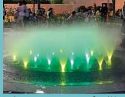
↑夜間ライトアップの様子