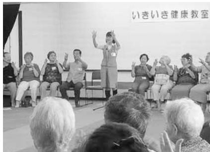
いきいき健康教室

安心・安全なまちへ お互いに見守り合い、声を掛け合い、安心・安全なまちをつくりまします。