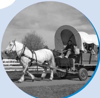
▲園内をのんびり巡る馬車。 1周400円、中学生以下200円

野菜の収穫やバター作り体験などを通して、農業と食の魅力を発見できる施設です。広大な園内ではレンタサイクルやパークゴルフなども楽しめます。