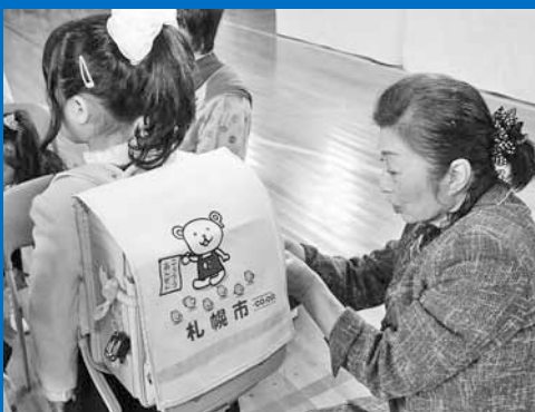
▲手稲鉄北小学校で新1年生に交通安全ランドセルカバーの贈呈式が行われました(4月6日)。