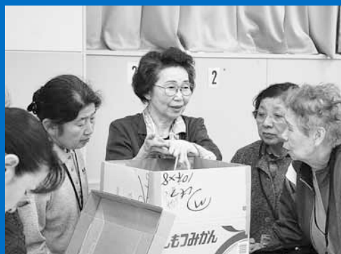
▲ダンボール箱を使った生ごみ堆肥化(たいひか)の講習会が手稲老人福祉センターで開催されました(3月24日)。