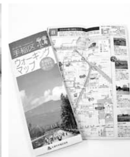
▲【地域の健康づくり推進事業】ウォーキング、運動体験、健康講演会などの健康づくり事業を推進します。