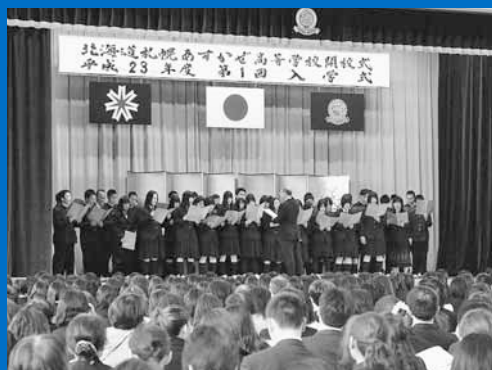
▲札幌あすかぜ高校の開校式が行われ、新しい校旗や校歌が披露されました(4月8日)。

人口140,011人(前月比+6) 世帯数55,517世帯(前月比+104) 平成23年4月1日現在