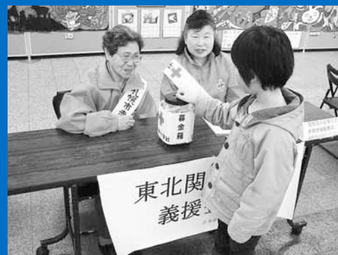
▲区役所1階ロビーで日本赤十字社による東日本大震災義援金の受け付けを行いました。4月1日からは、引き続き1階広聴係に募金箱を設置しています。