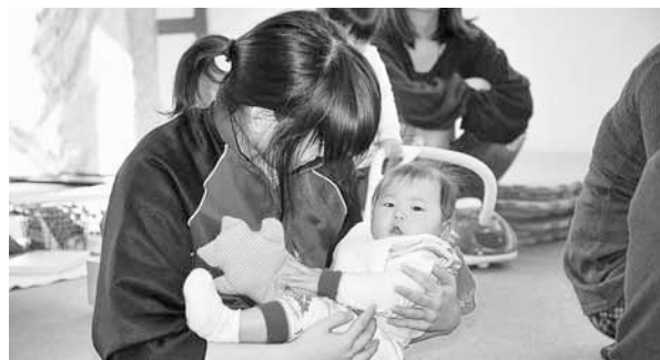
▲【次世代育成支援事業】小中高生が赤ちゃんとの出会いを通じて、親になる準備を進めるための「赤ちゃんってすごい！」事業を実施します。