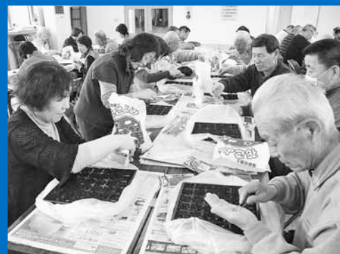
▲地域の街路樹升などに植える花苗の育て方を学ぶ「マイタウン・マイフラワー講習会」が山口団地会館と鉄北コミュニティプラザで開催されました(3月25日)。

編集 手稲区役所総務企画課広聴係 〒006-8612 札幌市手稲区前田1条11丁目 Tel:681-2400(内線224) Fax:681-6639 ホームページ「ていねっていいね」 http://www.city.sapporo.jp/teine/