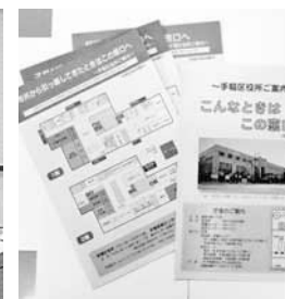
▲【市民サービスアップの推進と向上】わかりやすいパンフレットの作成や職員研修を通してサービスアップを目指します。