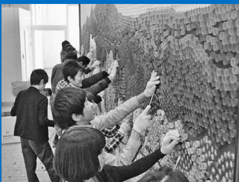
▲手稲区区制20周年記念事業で制作した大型モザイク画の解体作業が北海道工業大学で行われました。使用していたキャップはリサイクルされ、ポリオワクチンとして提供する活動団体に寄付されます(4月12日)。