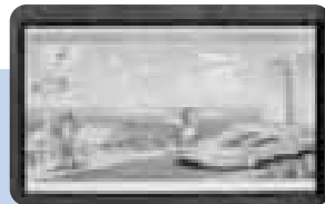
↑モニターの名前は「さっぽろ水道のエコ・エネルギー」

地下1階「もいわギャラリー」の大型モニターのプログラムをリニューアル。市の水道局が活用するエネルギー「水力」と「太陽光」による発電量などが次々と映し出されます。