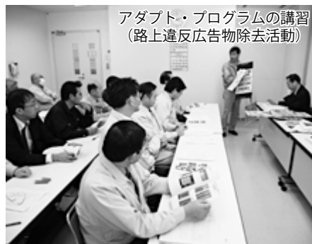
アダプト・プログラムの講習 (路上違反広告物除去活動)

その後、西区における参加団体は年々増え、現在では町内会や企業、病院、学校など31団体がそれぞれの地域で環境美化に取り組んでいます。 平成13年5月、琴似商店街振興組合の活動開始により、西区でのアダプト・プログラム事業が始まりました。