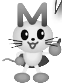
「まちっちい」 まちづくり応援キャラクター