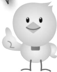
「じっちい」 自治基本条例キャラクター