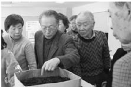
2/22 (火) 生ゴミ堆肥化講座