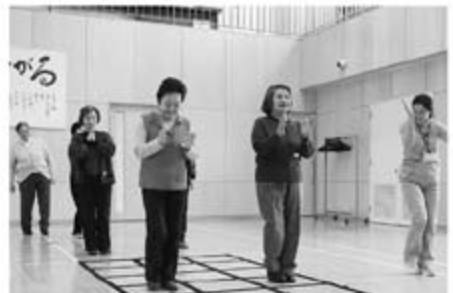
3/10 (木) いきいき講座～介護予防体操