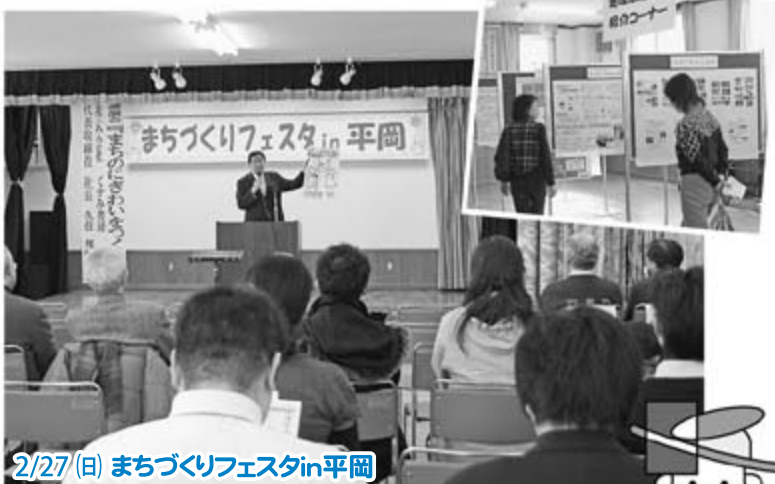
2/27 (日) まちづくりフェスタin平岡

講演会やパネル展を通して、身近なことから取り組む「まちづくり」について考えたよ!