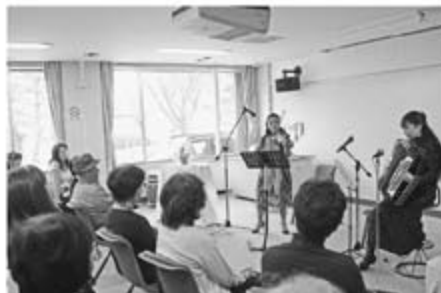
2/25 (金) アフタヌーンティーコンサート