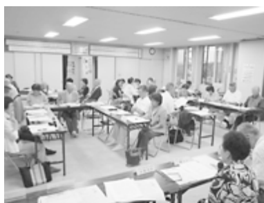
北野地区福祉のまち推進センター運営委員会での会議

北野地区では平成19年度から地域防災について検討を開始。住民の意識調査や研修、DIG（地図上で行う災害時の訓練）などの演習を行ってきました。