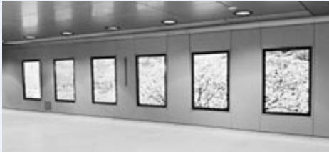
▲地下歩行空間北2条広場(掲出開始時期は未定)

区内で撮影した写真をお寄せください。全作品を区ホームページに掲載するほか、本誌や駅前通地下歩行空間などでも一部ご紹介します。