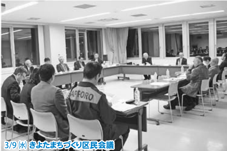
3/9 (水) きよたまちづくり区民会議

町内会や学校などさまざまな団体の代表者が、地域と行政の協働によるまちづくりについて意見交換。平成23年度は「防災」をテーマに取り組むことを決定しました。