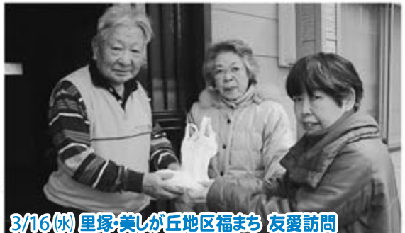
3/16 (水) 里塚・美しが丘地区福まち 友愛訪問