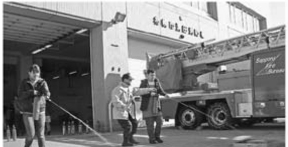
2/28 (月) グループホーム安全対策研修会