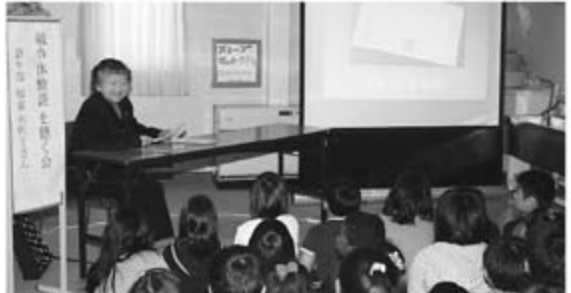
2/21 (月) 戦争や平和の話と一緒に聴きませんか?

町内会や学校などさまざまな団体の代表者が、地域と行政の協働によるまちづくりについて意見交換。平成23年度は「防災」をテーマに取り組むことを決定しました。