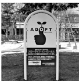
活動区域に設置する看板、ロゴマークは、区内の専門学校生がデザインしました

道路や公園などの公共空間を養子（アダプト）に見立て、北区と覚書を交わした区内の団体や企業が、里親となって清掃活動を行う「北区アダプト・プログラム事業」。昨年度から、5つの団体が活動を始めています。 北区では、引き続きこの活動を支援、区民とのパートナーシップのもとで地域の美化を進めます。