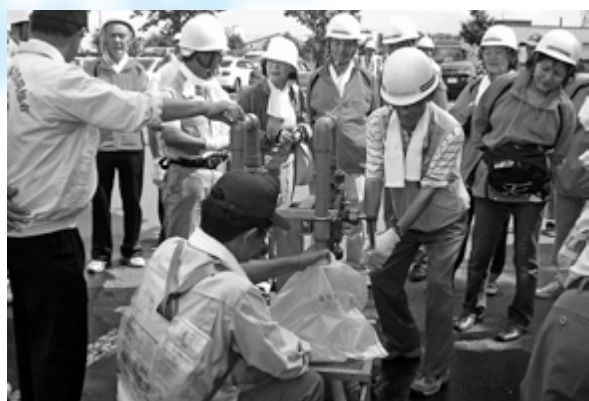
緊急貯水槽で給水訓練に参加する住民の皆さん

昨年2月、まちづくり活動に取り組む48団体によって立ち上げられた「北区まちづくり協議会」。地域の取り組みや地域が抱える課題などを、団体間で共有しながら、まちづくりに生かします。 同協議会では、防災を当面の活動テーマに、被災者の声を聞く講演会を開催したり、地域の特徴的な取り組みについて、情報を交換したりしました。 また、北区で行われた札幌市総合防災訓練では、自力での避難が困難な方々の避難訓練を提案、福祉施設に参加を呼び掛けるなど、地域の防災意識の向上に努めています。