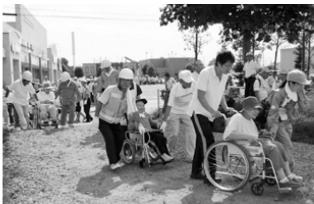
同協議会が呼び掛け、地域の福祉施設も参加しました