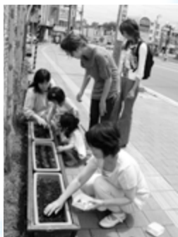
上・右：地域で亜麻を植える住民の皆さん