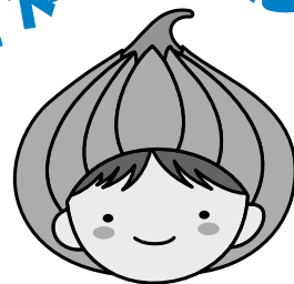
東区マスコットキャラクター「タッピー」