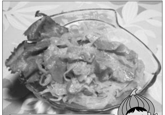
スモークサーモンが2種類のタマネギの味を引き立てます。