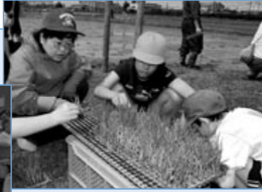
▲小学校農作業体験の支援 子どもたちの付き添いや、田植えのお手伝いなどを受け持ちました。