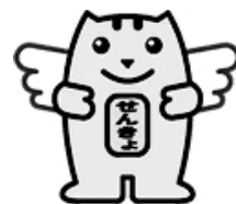
明るい選挙キャラクター 選挙のめいすいくん