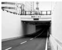
↑平成21年に開通した 創成トンネル

しかし、平成に入ってから交通の混雑、創成川を挟んだ東西地域の交流が減っていることが課題に。そのため、南北二つのアンダーパスをトンネル化し、これにより生まれた地上部に水辺に親しめる緑地を整備しました。歴史や芸術に触れられ、イベント広場もある公園です。