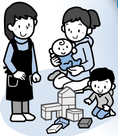
子育てや学校 への協力活動