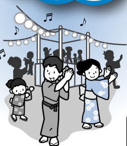
健康づくり・ 文化活動