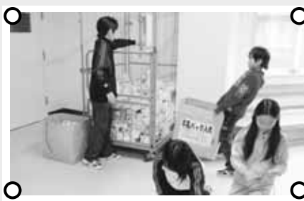
↑牛乳パックは各学級で集めて束にして保管。たくさんたまったら、リサイクルに出しています

水曜は水を使い過ぎない、金曜は給食を残さないなど、曜日ごとに環境に優しい行動をしています。また、全校で牛乳パック集めやごみ拾いを行っています。