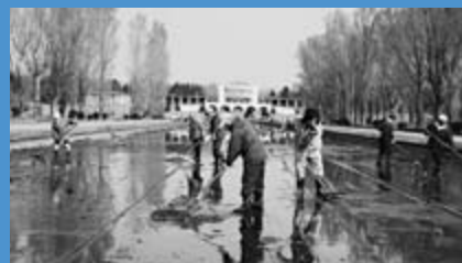
▲前田森林公園で公園ボランティアによるカナル（運河）の清掃作業が行われました（11月7日）。