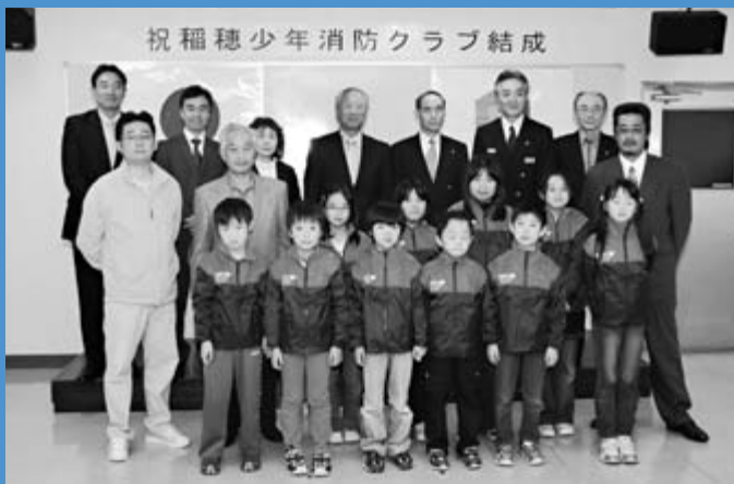
▲稲穂少年消防クラブが結成され、少年消防クラブの真新しい制服を身に付け結成式が行われました（10月25日）。

人口と世帯数は、国勢調査実施に伴い、速報値が公表されるまでの間は掲載を見合わせます。