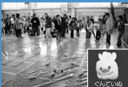
▲手稲山口小学校で「てつほくあそびねっと」が開催され、軍手から「ていぬ」を作り「ていぬペタンク」というゲームを楽しみました（10月30日）。