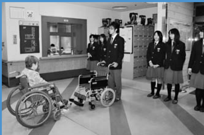
▲稲穂中学校生徒会がアルミ缶のプルタブを集めて交換した車いすを特別養護老人ホーム「札幌市稲寿園（とうじゅえん）」に寄贈しました（10月28日）。