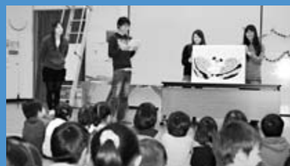
▲手稲中央幼稚園で、北海道工業大学の学生が「ていぬ」紙芝居を披露し、園児は楽しい時間を過ごしました（11月10日）。

編集 手稲区役所総務企画課広報係 〒006-8612 札幌市手稲区前田1条11丁目 Tel:681-2400 (内線224) Fax:681-6639 ホームページ「ていねっていいね」 http://www.city.sapporo.jp/teine/