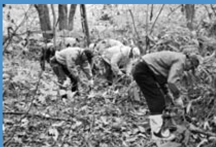
▲本格的な冬が始まる前に富丘西公園（写真上）と稲穂ひだまり公園（写真下）で大掃除が行われました（10月31日）。