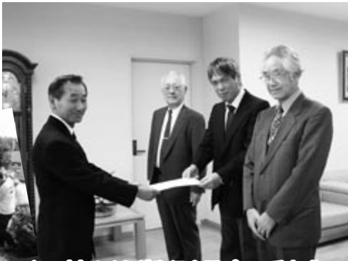
9/30(木) やすらぎ歩行空間プラン手交式

旧国道36号を心地よく利用するための将来像を、区 民や有識者などによる検討会がまとめました。