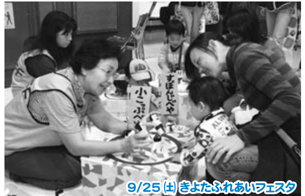
9/25(土) きよたふれあいフェスタ

旧国道36号を心地よく利用するための将来像を、区 民や有識者などによる検討会がまとめました。