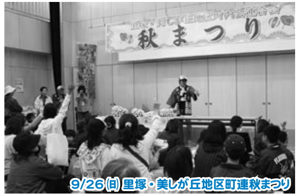
9/26(日) 里塚・美しが丘地区町連秋まつり

ストラックアウトやウオーキング、野球教室など盛りだくさん。約3千人の 区民がスポーツの秋を満喫しました。