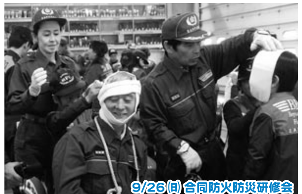
9/26(日) 合同防火防災研修会

少年消防クラブ員が、消防団員の手ほどきを受けながら、応急 処置などの訓練に取り組みました。