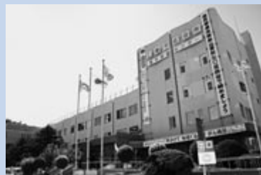
▲耐震工事も終了しました