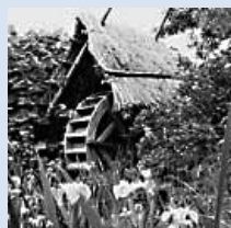
かつて西野地区に あった水車小屋

まちづくりセンターと各団体は連携して、 五天山公園に復元された水 車を活用したイベント開催 などを通して、こうした歴 史を子どもたちや地域住民 に伝える活動を行っています。