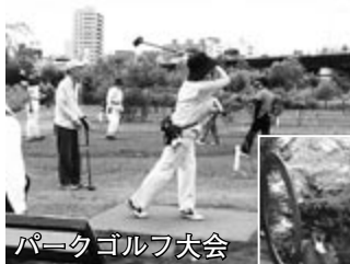
パークゴルフ大会