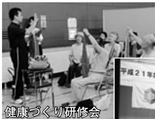
健康づくり研修会

ウォーキングやパークゴルフなどの健康づくり、歌や踊りなどのサークル活動のほか、公園清掃や子どもたちの交通安全指導などのボランティア活動も行っています。