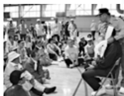
▲災害訓練のようす

【安全安心まちづくり宣言】「まちづくりは最大の治安」を合言葉に、各地域で安全・安心なまちづくりを目指して、災害訓練や研修会を行っています。