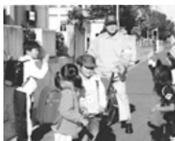
▲見守り活動のようす

【見守り活動】青色回転灯パトロール隊の活動をはじめ、地域全体で連携を強めて、高齢者や子どもを見守ることにより、事件や事故、そして犯罪のないまちを目指しています。