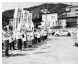
▲不法投棄撲滅啓発パレード

【地区交通安全指導員との合同懇談会】交通安全の取り組みをより一層推進するため、情報交換や意見交換を行い、連携を強めています。