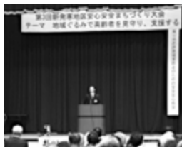
▲安心安全まちづくり大会

【安心安全まちづくり大会】安全で安心なまちづくりを推進するため毎年実施しています。今年は体験実践型の防犯教室を開催し、住宅の侵入手口のピッキングやサムターン回しの実演を見学し、犯罪手口を体感します。