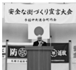
▲安全な街づくり宣言大会

【安全な街づくり宣言大会】暴力、犯罪、交通事故や災害のない街を地域住民の手でつくりあげようと、関係する団体の代表者を招き、「安全な街づくり宣言」を宣誓しています。事件や事故、災害時の相互協力体制に関して意識の向上を図っています。