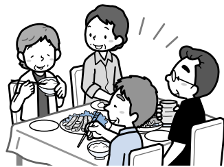
食事会、異世代交流会、各種サロンなどの開催