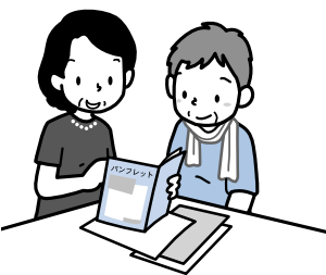
福祉サービスに関する情報提供、専門機関の紹介