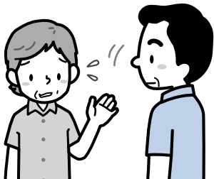
暮らし、育児、介護など生活や福祉の悩み・相談の受け付け