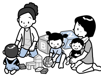
育児相談、児童虐待予防活動、子育てサロンの運営や協力