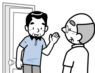
ひとり暮らしの高齢者への声掛けなどの見守り活動