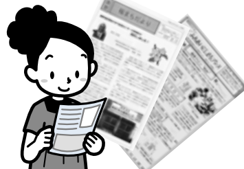
地域の行事や活動を紹介する広報誌、チラシの作成・配布

Q. 「福祉のまち推進センター」って何をしている所？ A. 地域住民が自主的に、高齢者宅への訪問や各種サロンの開催など、さまざまな福祉活動を行っている所です。