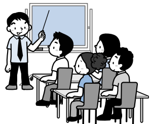
介護予防、ボランティア活動など各種研修会の開催