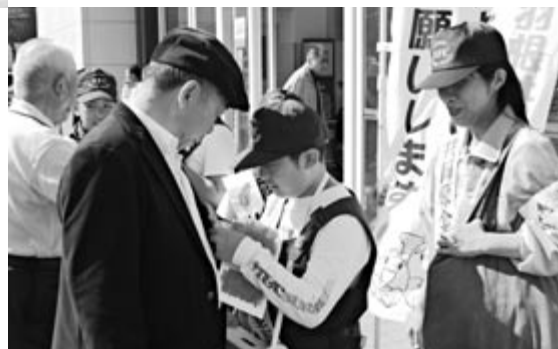
■昨年の街頭募金の様子。

※西区共同募金会(事務局:西区社会福祉協議会)では、毎年恒例となっている「赤い羽根共同募金チャリティー演芸大会」を11月7日(日)に開催します(詳細は本誌10月号「西区からのお知らせ」に掲載予定)。