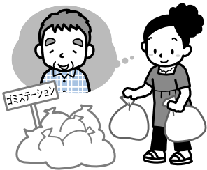
高齢者の見守り・安否確認、ごみ捨てなどの日常生活支援