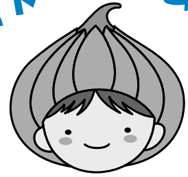
東区マスコットキャラクター「タッピー」