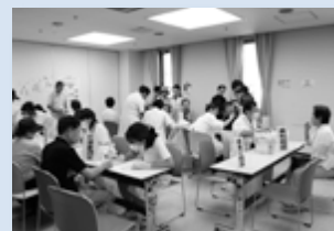
▲健康度チェックの様子

時間 ①午後1時から、②午後2時から。雨天決行。 区民センター1階ロビーで受け付け。 定員 ①、②各先着40人。 申込 8月11日(水)～26日(木)に保健センターに電話で申し込み。 ※ポール（ストック）はご用意いたします。