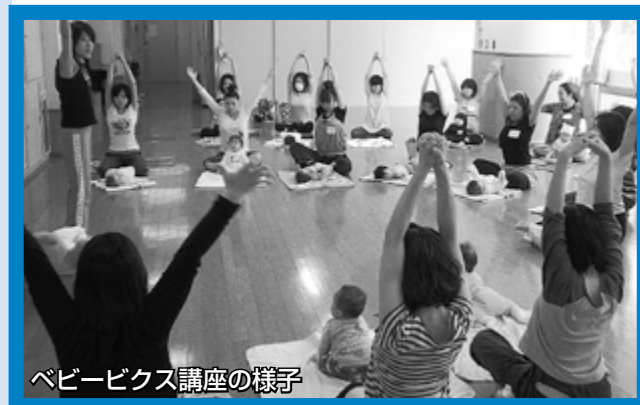
ベビーピクス講座の様子