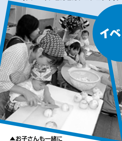
▲お子さんと一緒に調理に参加します（カレーパーティー）。