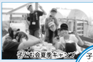
子ども会夏季キャンプ

子ども会は、楽しい体験ができるんだね。新しいお友だちもできそうだよ。興味を持ったら参加してみよう！