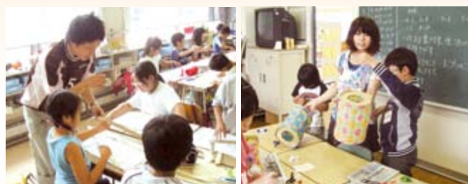
▲道工大生がちょうちん制作の指導をしています

このイベントは、手稲の子どもたちが中心となって制作したちょうちんを一斉に飾り、手稲の夜を彩ることで、子どもたちに夢と感動を与え、ふるさと手稲への愛着を育むことを目的としています。現在、手稲区内全小学校と児童会館だけでなく、福祉施設や老人クラブなど、世代を超えたさまざまな団体がちょうちん作りに取り組んでいます。北海道工業大学の学生が各学校を訪問して、子どもたちへの情報提供とちょうちん制作指導を行っています。