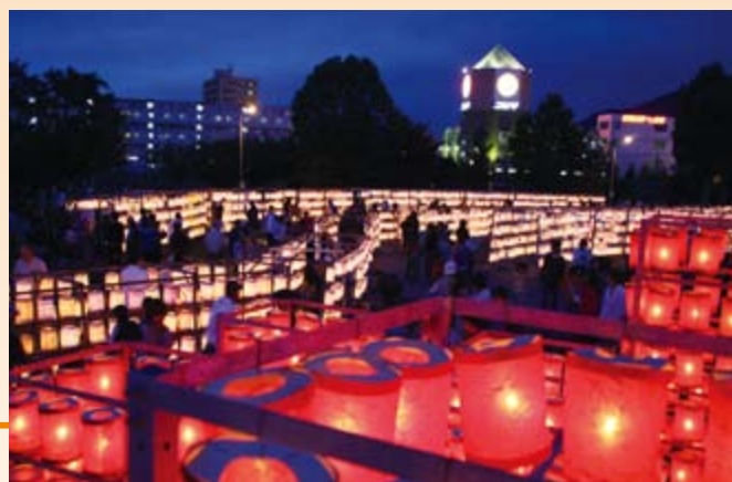
▲今年も約1万個のちょうちんが会場を彩ります

平成4年、450個のちょうちんから始まった「ていね夏あかり」は、平成21年に1万個を超えました。その壮大で厳粛な造形空間の美しさは高く評価され、平成9年には「札幌市都市景観賞特別賞」、19年には「北のまちづくり賞北海道知事賞」を受賞し、20年には「まちづくり功労者」として、国土交通大臣より表彰を受けています。