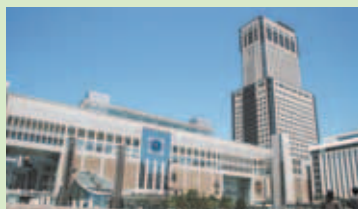
↑札幌駅を利用する来札者の都心部の回遊を促します

デザイン性に優れた車両や停留場が都心部の新たな魅力となり、多くのにぎわいを運びます。