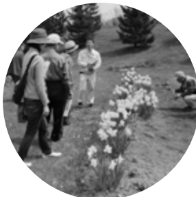
◀春の観察会の様子

6月には夏の花「タチアオイ」を植えます（詳細は手稲区民のページ4ページをご参照ください）。また7月には夏の花と自然観察会、夏のほしみナイトがあります。