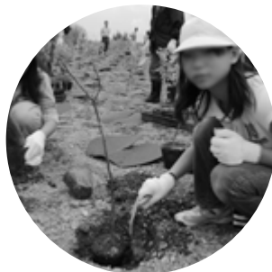
▲平成21年植樹祭の様子

また市民とともに進める「さっぽろふるさとの森づくり」植樹祭の会場となっています。