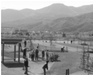
▲人気のパークゴルフ場