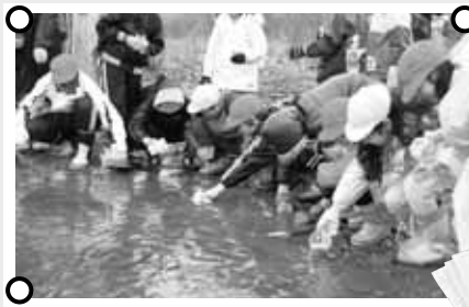
↑ 5,000匹以上のサケの稚魚を放流

校内にある「サケ学習館」で、11月にサケの卵に精子をかけて授精させ、5年生が世話をします。稚魚になったら、全校児童で「大きくなって帰ってきて」と願いながら、豊平川に放流します。