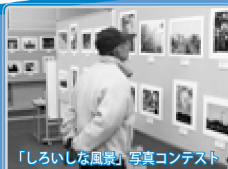
「しろいな風景」写真コンテスト

豊かな人間関係が生まれ、地域のまちづくり活動が盛んになるよう、まちづくり協議会やボランティア団体、福祉のまち推進センターなど団体間のコミュニケーションの活性化を図り、地域力の向上を目指していきます。