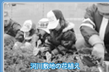
河川敷地の花植え