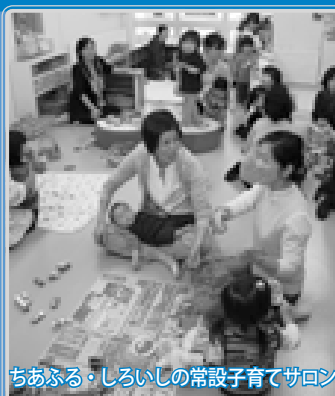
ちあふる・しろいの常設子育てサロン