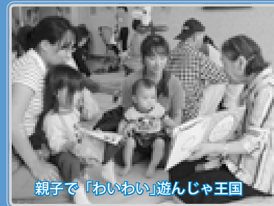
親子で「わいわい」遊んじゃ王国

「白石区実施プラン」のお問い合わせ 白石区総務企画課 ☎861-2400内線212