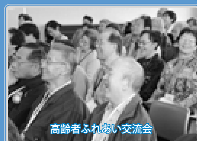
高齢者ふれあい交流会