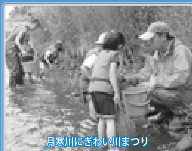
月寒川にぎわい川まつり