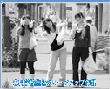
専門学校生とクリーンアップ作戦