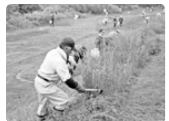
あしりべつ川的环境整備(清田)