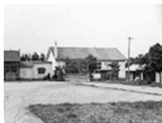
歴史探訪(里塚・美しが丘)

HP http://www.city.sapporo.jp/kiyota/town/plan/