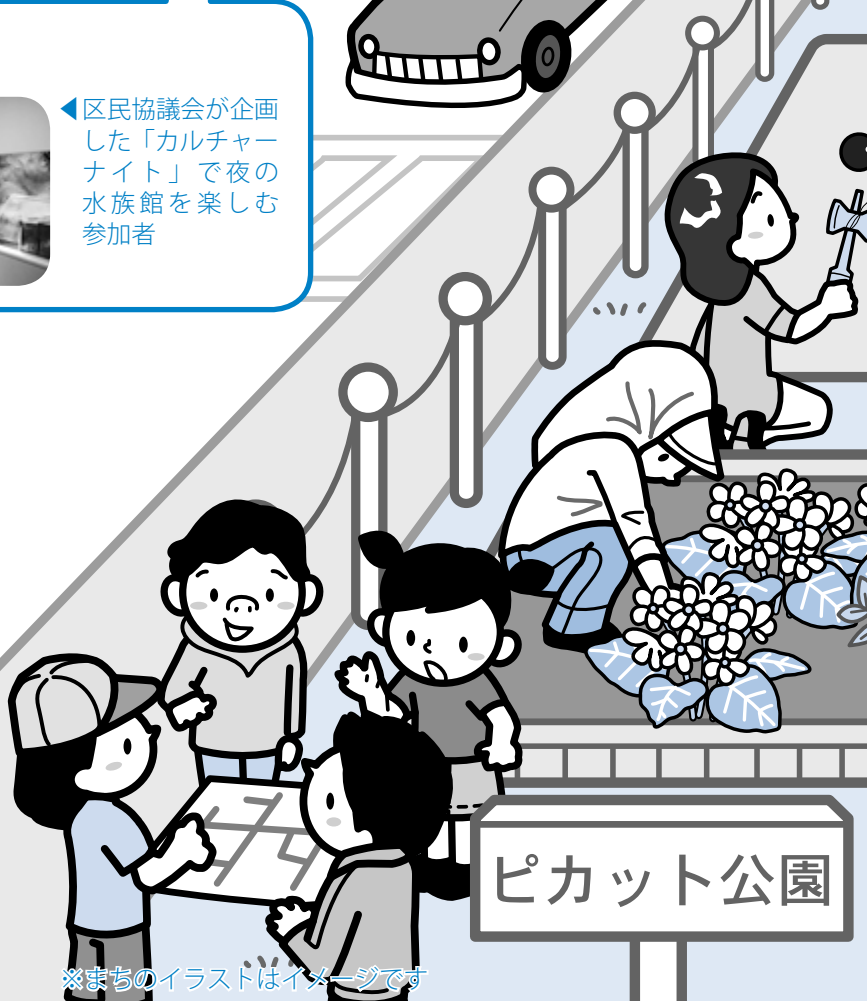
※まちのイラストはイメージです