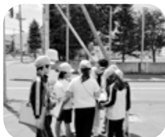
▲小学生による地域安全マップづくり

防犯・防災活動と、地域の自主防災の取り組みへの支援など「安全なまちづくり」を推進します。