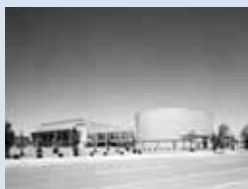
主要会場となる コンベンションセンター

オーストラリア、ブルネイ、カナダ、チリ、中国、中国香港、インドネシア、日本、韓国、マレーシア、メキシコ、ニュージーランド、パプアニューギニア、ペルー、フィリピン、ロシア、シンガポール、チャイニーズ・タイペイ、タイ、米国、ベトナム