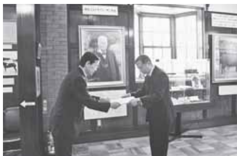
▲エドウィン・ダン記念館（3/7）

北海道酪農協会から、エドウィン・ダンの偉業を描いた貴重な絵画や写真などが、北海道宅建協会からは、キャスター付き担架が、それぞれ南区に寄贈され、南区長から感謝状が贈られました。