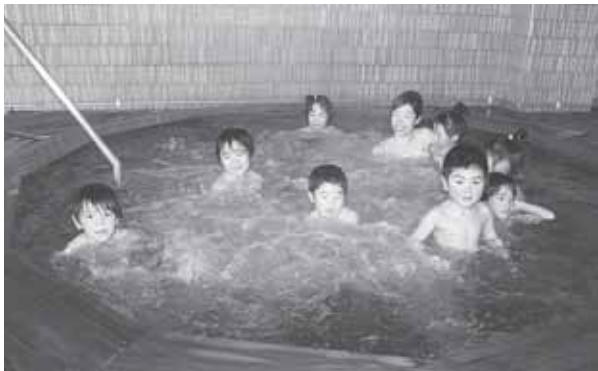
▲いい思い出になるね！

定山溪保育所が、ホテル鹿の湯で卒園記念の入浴会を行いました。園児たち8人は、一緒に湯船につかったり、輪になって背中を洗い合ったりして温泉を満喫しました。