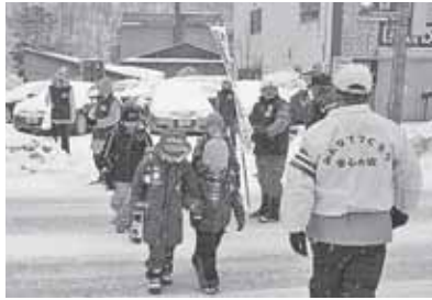
▲活動団体と一緒に子どもの見守り活動を体験しました！

「まちづくり活動団体」の活動の場を訪ね、実際の取り組みを体験したり見学したりしました。