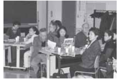
▲積極的な意見交換が行われました！