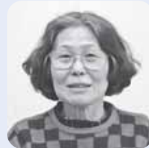
ふれあい配食ボランティア 「たんぼぼの会」

この教室では、団体がどんな活動をしているかや自分に合う曜日・時間帯の活動があるか、また活動団体の雰囲気などを事前を知ることができました。その中から、私はこの配食ボランティアの活動を選び、今は「たんぼぼの会」のメンバーとして、仕事と両立しながら、皆さんと楽しく活動しています。