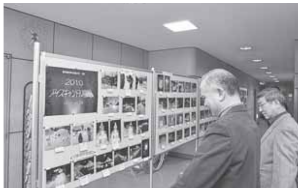
▲上手に撮れているね！

もいわ地区センター1階ロビーで「アイスクャンドル写真展」が行われました。これは、1月末に同地区町内会連合会が開催したアイスクャンドルを題材に、地域住民が撮影した198点にのぼる力作を展示したものです。会場を訪れた人は、感心した様子で作品を眺めていました。