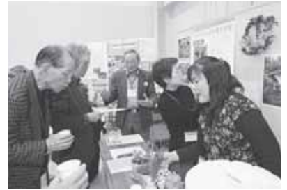
▲こんな活動をしていますよ～！参加してみませんか～？

南区で活動している「まちづくり活動団体」を紹介するコーナーを設けて、各団体の活動をPRしました。