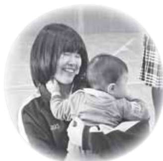
赤ちゃんの重みに命の重みを実感しました↑

生徒たちは年の離れた乳幼児に戸惑いながらも、抱っこをしたり、おもちゃで遊んだり、楽しいひとときを過ごしました。