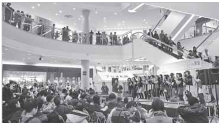
↑ゴスペルの歌声が聞こえ始めると、会場にはたくさんの聴衆が集まりました

COME (カム) はCommunity Market in East wardの略称で「来てね!」という意味も込められています。東区を中心に活動している市民活動団体による、情報発信のイベントです。展示ブースや楽しいパフォーマンスで、今年もイベントを目当てに来た人、買い物帰りの人々で大いににぎわいました。