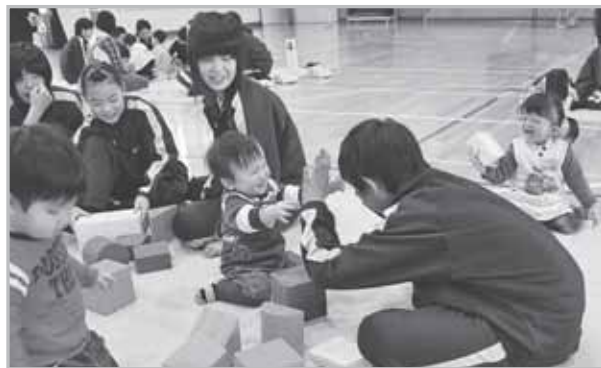
↑最初はたくさんのお兄ちゃんお姉ちゃんに囲まれて緊張気味だった子どもたちにも、すぐに笑顔があふれました