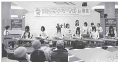
← 琴や琵琶などの音楽のほか、フラダンスや日舞といった多彩なステージでした