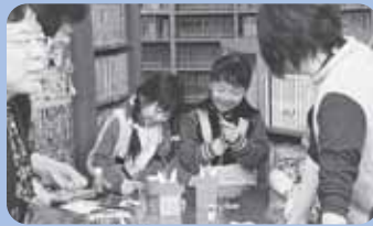
▲月に1回、工作会も行っています

やまびこ座では、 毎週水曜午後3時 30分から、ボランティ アによる絵本や紙芝居の読み 語りをを行っています。無料な ので気軽に聞きに行ってみよ う!