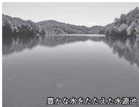
豊かな水をたたえた水源池

豊 かな自然が広がり、四季それぞれに美しい表情を見せる西岡公園。その入口は住宅街の南の端にあり、誰でも気軽に自然を楽しむことができます。造られてから一世紀になる水源池を中心に南側には湿原が広がり、公園は、たくさんの野生の動植物のすみかとなっています。春にはミズバショウが咲き、夏にはホタルが飛び交います。生息するトンボの種類は道内で一番とされています。バードウォッチングにも絶好の場。さまざまな野鳥を見ることが出来ます。運がよければ、美しいカワセミや天然記念物のクマゲラに出会えるかもしれません。