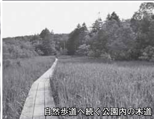
自然歩道へ続く公園内の木道

西岡に水源池が造られたのは一九一〇（明治四十三）年。陸軍の歩兵第二十五連隊が月寒川の上流をせき止め、貯水池としました。ここから引かれた月寒水道は、軍の施設だけでなく周辺の市街地へも水を供給しました。第二次世界大戦後、月寒水道は豊平町に引き継がれ、札幌市と合併した後の一九七一年（昭和四十六）年まで、市民ののどを潤しました。その面影を残す取水塔は、二〇〇一（平成十三）年に、国の登録文化財となりました。昨年、奇麗に補修され、造られてから百年目の今でも人々の目を楽しませています。