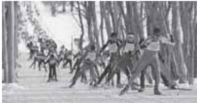
札幌国際スキーマラソン大会の様子

でしたが、雪不足のため、なかなか仕上げる事ができず、できあがったのは二十二日。大会が始まるまで二週間もありませんでした。 大会は好天に恵まれ、二月四日から始まった距離競技は、連日、白熱したレースが繰り広げられました。熱戦が続くコースは、大会役員や自衛隊などにより、期間中、完璧な維持管理が行われ、参加した各国の選手から、大きな賞賛を受けました。 大会後、発着地点に設けられた運営本部などの建物は、民間に払い下げられ、撤去されました。しかし、コースとなった丘陵地の一部は、今でも札幌国際スキーマラソン大会などで使用されており、多くの市民が雪原を駆け抜けています。 また、西岡水源池の周りは整備され、一九七七(昭和五十二)年に西岡公園となりました。冬期間には、歩くスキーなどを楽しむ人の姿も見られます。