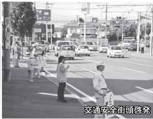
交通安全街頭啓発