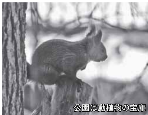
公園は動植物の宝庫

散策路はもろろん、湿原には木道が整備され、自然歩道に通じています。白旗山などへ足を伸ばすことも可能。体力に合わせて森林浴やウォーキングを満喫できます。西岡公園の魅力は尽きることはありません。