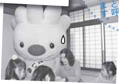
和室では英語のサークルが活動していましたよ。

ていぬ君、こんにちは。ここではいろいろな講座やイベントのほか、サークル活動のためにお部屋を貸したりしてあるんですよ。地域の方からは「コミセン」と呼ばれ親しまれています。