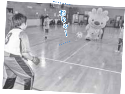
ホールでやっていたサッカーの練習に混ぜてもらいました！