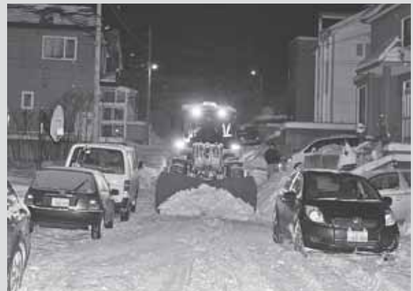
◀生活道路の除雪の様子。路上駐車があると、均等な除雪は困難です

A 道路状況により左右に寄せる雪の量が異なるときもありますが、できる限り均等な除雪を心掛けております。なお、以下の行為は均等な除雪の妨げとなりますので、地域の皆さまのご協力もお願いします。 ①路上駐車 車を避けながらの除雪となるため、向かいや隣の家の前に多くの雪が寄せられてしまいます。 ②道路への雪出し 道路へ雪を捨てると、次の除雪作業で隣に多くの雪が寄せられてしまいます。 ③周囲より雪山を道路側につくる 雪の堆積場所を大きくしようとして、雪山を道路側にせり出すと、せり出した部分がどうしても隣に寄せられてしまいます。